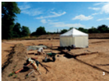
3. Fouilles en cours sur le site d'Agreen-Tech